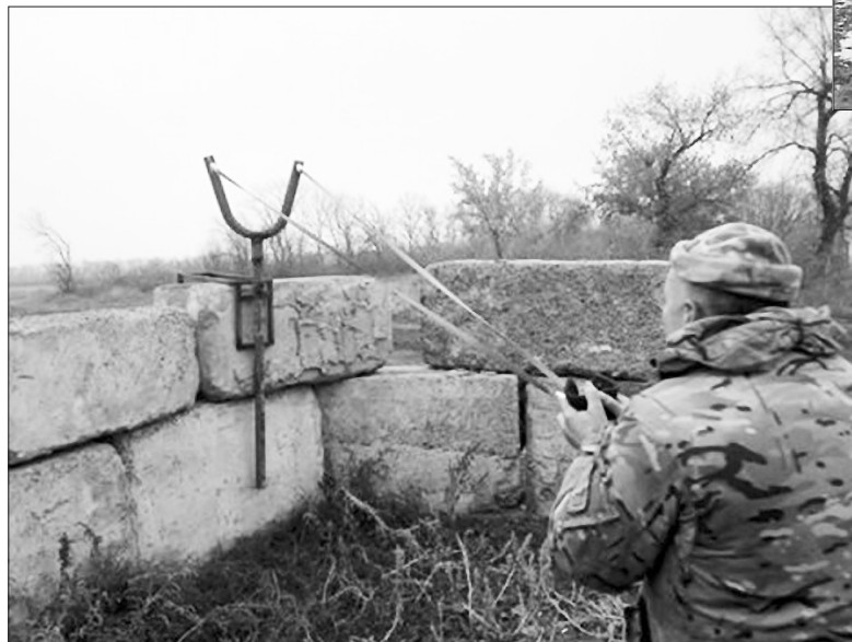
Костянтин Холодов 1 ч